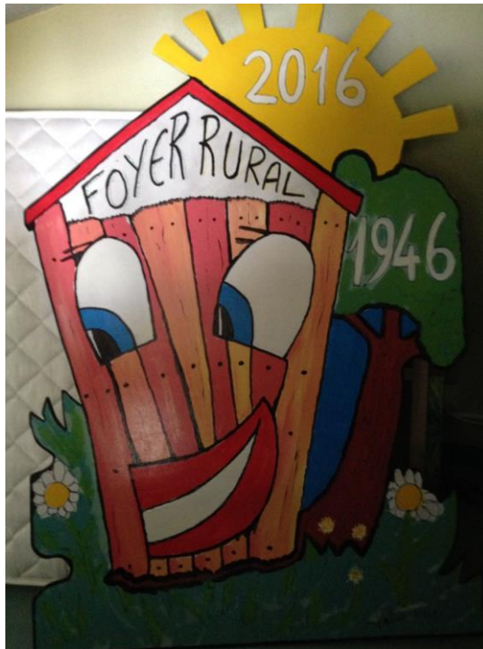
Logo en 3D du foyer rural de Grand Village Plage

Les deux foyers ruraux de l'île d'Oléron, continuent à peaufiner l'accueil du réseau. Qu'il s'agisse des décors du site :